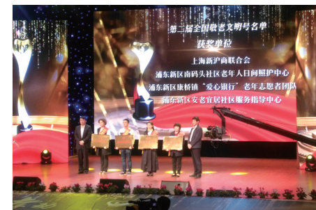
上海新沪商联合会代表领受“全国敬老文明号”奖牌。