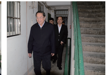
俞正声书记探望慰问新沪商助老义工和受助老人