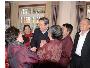
时任市委书记俞正声亲切看望潍坊街道新沪商助老志愿者