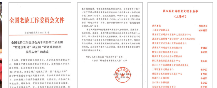
全国敬老文明号光荣册