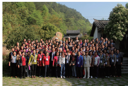
快乐的新沪商社区助老志愿者

生活施之援手，为他们送去亲情式关爱，使受助老人真切地感到了“老有所依”，有效缓解甚至消除了空巢老人居家养老的各种困惑与风险。让受助的孤寡、空巢老人真正过上了没有孤独、不再无助，有平安、有喜乐、有盼望、有尊严的居家养老生活。