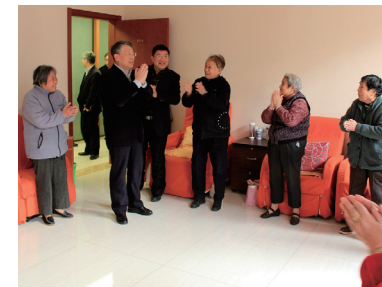
市委统战部沙海林部长a 亲切探望瑞金而路街道的受助老人