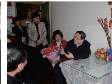
俞正声书记探望慰问新沪商助老义工和受助老人