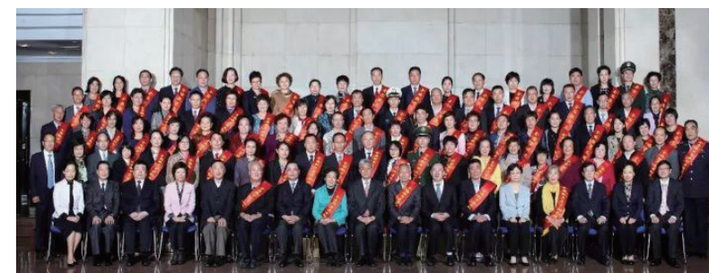
上海市市委副书记、市老龄委主任尹弘，上海市副市长、干老龄委副主任彭沉雷接见上海市荣获全国“敬老文明号”、“敬老爱老助老模范人物”称号的获奖代表，并合影留念。